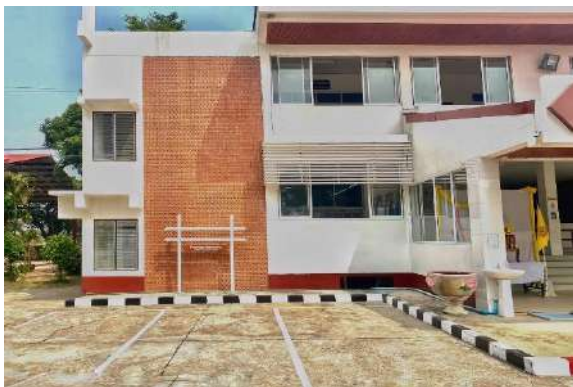
ที่จอดรถสำหรับประชาชนบริเวณด้านหน้า สภ.