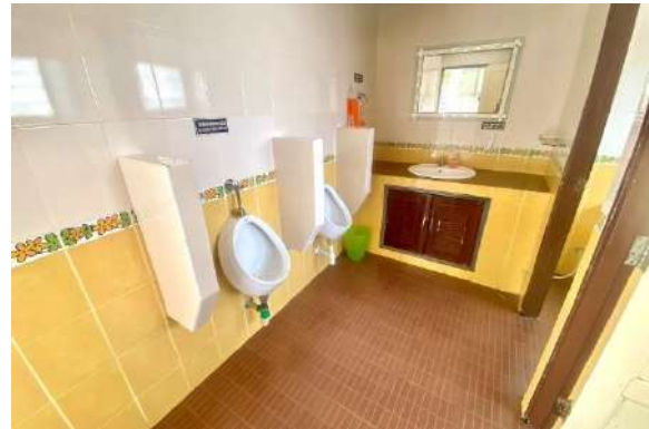
ห้องสุขาสะอาดแยกชายหญิงทั้งสองฝั่งอาคาร