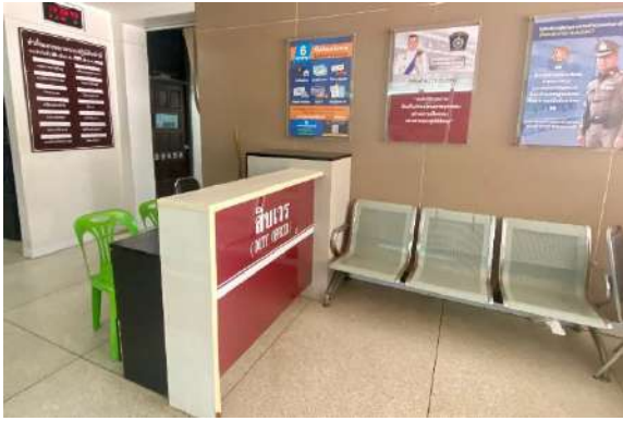
ที่พักนั่งรอสำหรับประชาชนผู้มาใช้บริการ ๓