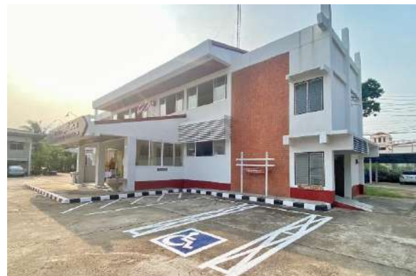
ที่จอดรถผู้พิการ