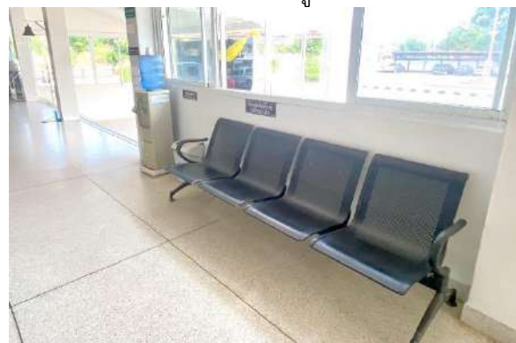
ที่พักนั่งรอสำหรับผู้มาใช้บริการ ๒