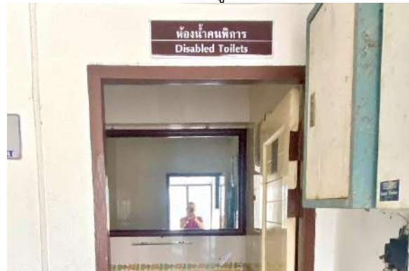
ห้องน้ำสำหรับผู้พิการ