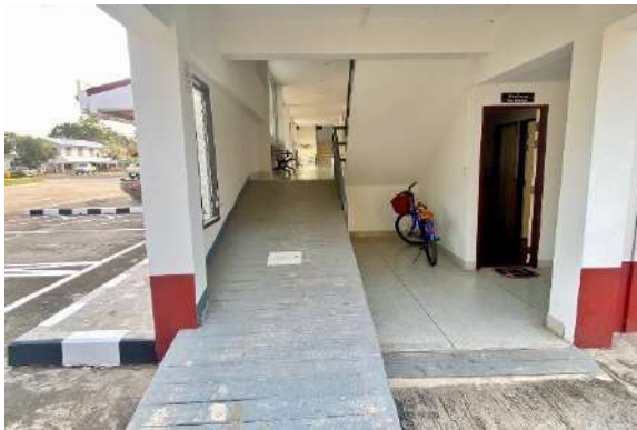
ทางลาดสำหรับผู้พิการ