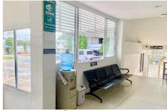
น้ำดื่ม ฟรีไวไฟ