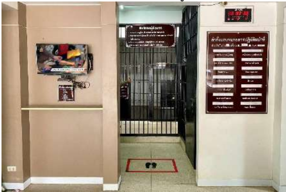
โทรทัศน์สถานีตำรวจแห่งชาติ POLICE TV